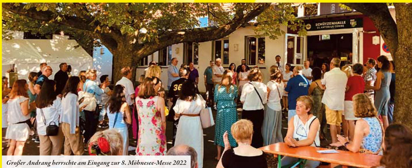
Großer Andrang herrschte am Eingang zur 8. Möhnesee-Messe 2022